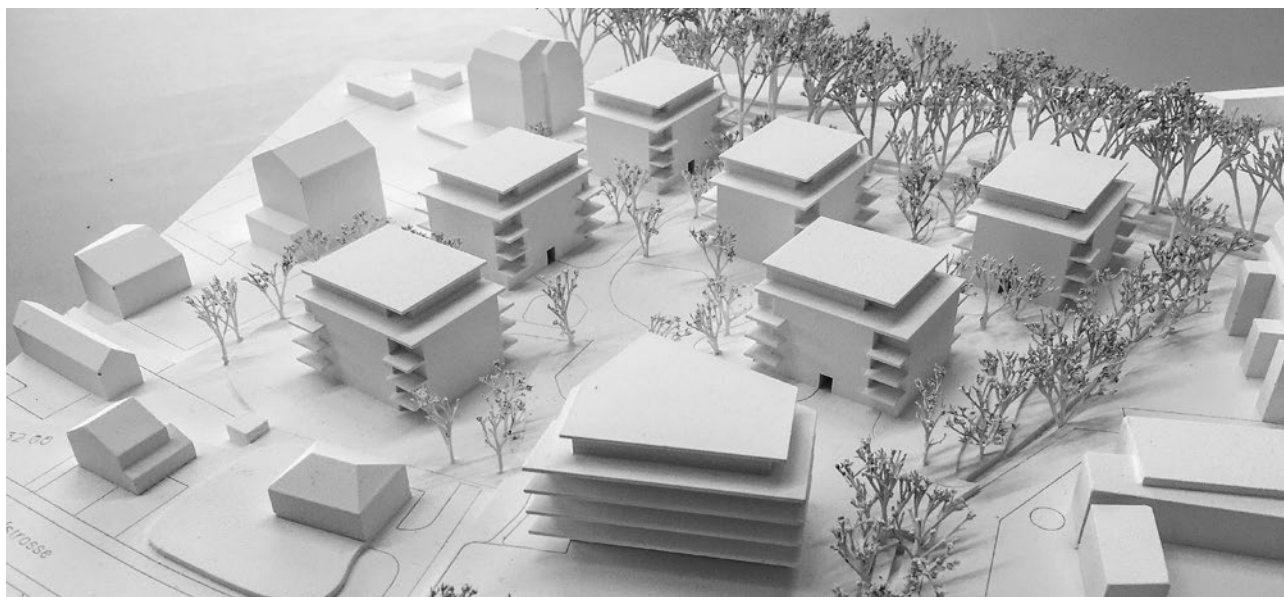
Am Heubächli in Grosswangen entsteht eine qualitätsvolle Wohnsiedlung mit sieben Gebäuden, 101 Wohnungen und einem Quartierladen.