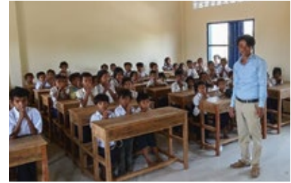
Schulalltag im neuen Gebäude.