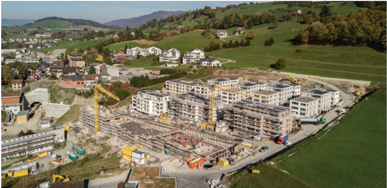
Projekt Rääbmatt in Küsnacht – wohnen am Fusse der Rigi.

Entwickeln, planen, realisieren, garantieren