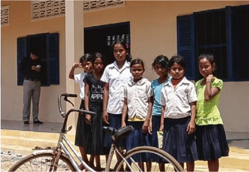
Das Unternehmen hat im Süden Kambodschas eine Schule finanziert.