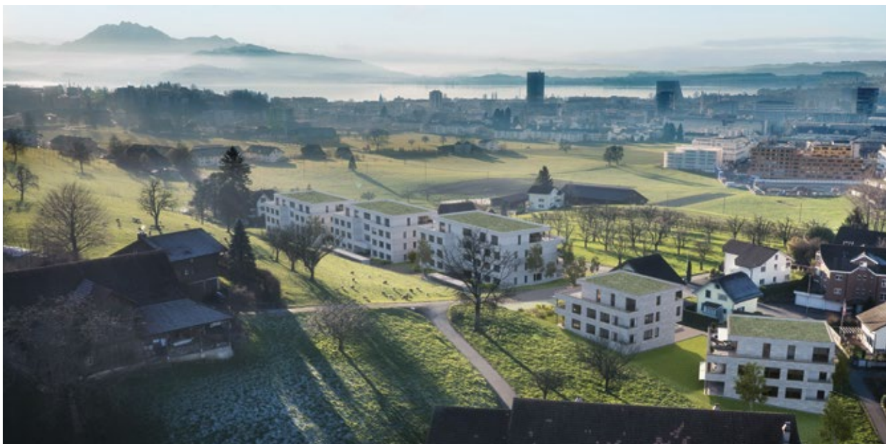
In Baar – Mühlematt – entstehen hochwertige Eigentumswohnungen mit Blick auf Zug.