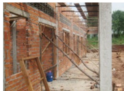
Rohbau ist erstellt.