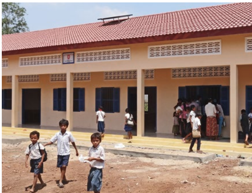
Erster Schultag im neuen Schulhaus.