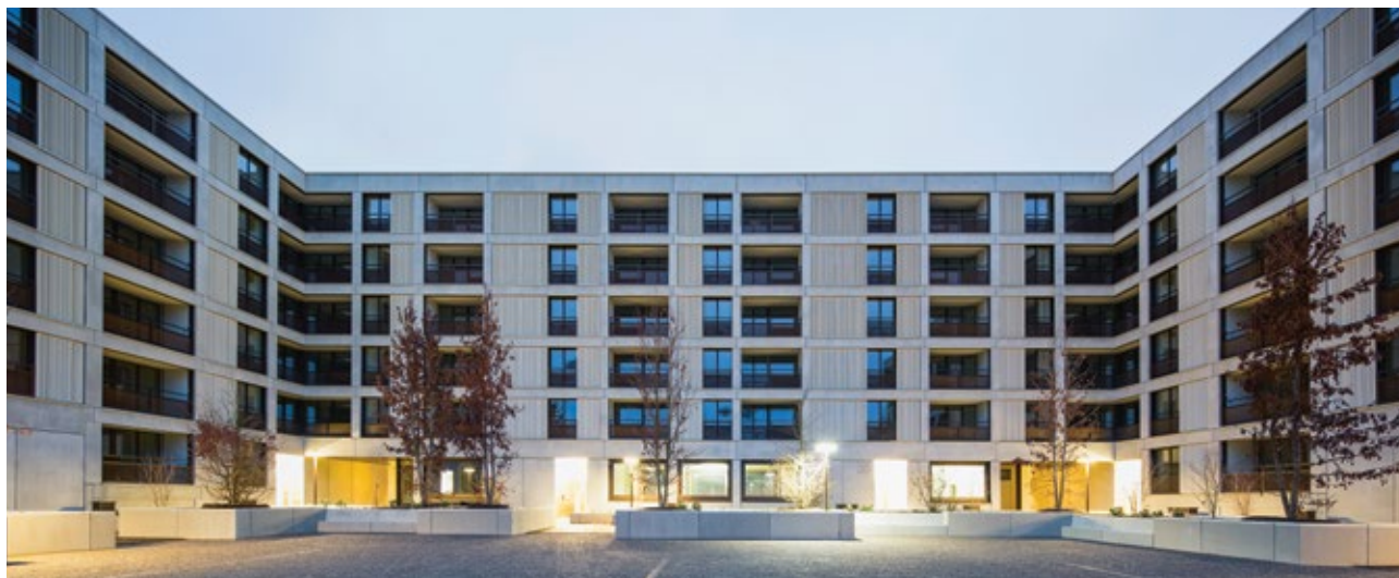
Die Realisierung der Fassade als Königsaufgabe: Die Aussenhaut des Baukörpers präsentiert sich als strukturiertes Relief (Streckmetall / Sichtbeton).

Wohn- und Geschäftshaus «Glattpark-Mitte»